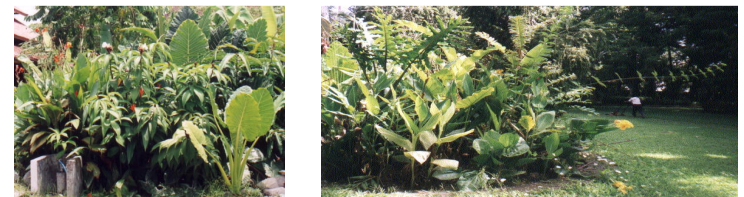
Taman BALI ( Buangan Air LIMbah) di Denpasar Bali